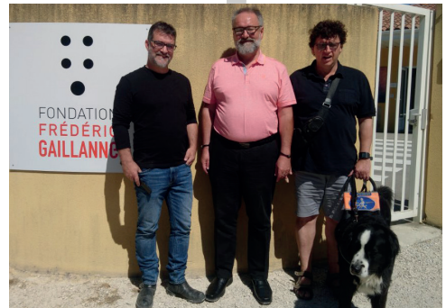
Renaissance-Handicap en visite à la Fondation FRÉDÉRIC GAILLANNE